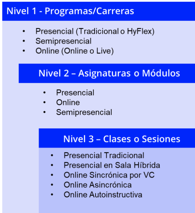
Figura 2. Modalidades de Estudio UCentral en 3 Niveles

De acuerdo con lo anterior, la modalidad de los programas/carreras de la Universidad Central definen un formato educativo de acuerdo con la incorporación de la virtualidad, y en función de esto las modalidades de asignaturas que se pueden incorporar y dentro de estas los tipos de sesiones, esto se explica en la Figura 3, a continuación: