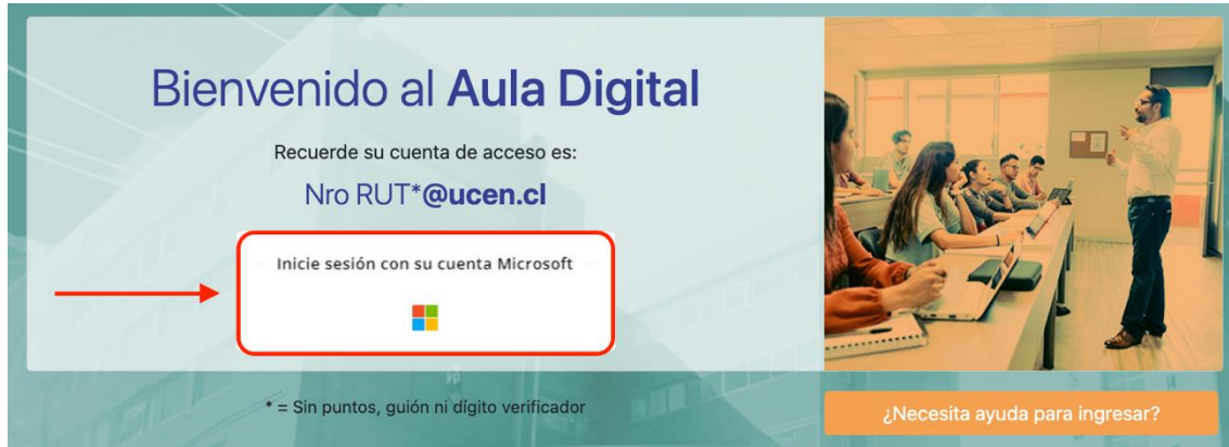
Figura 3. Interfaz de usuario con ícono de Microsoft 365

Luego de la acción anterior, haga clic en el ícono de Microsoft para iniciar la sesión con su cuenta institucional.