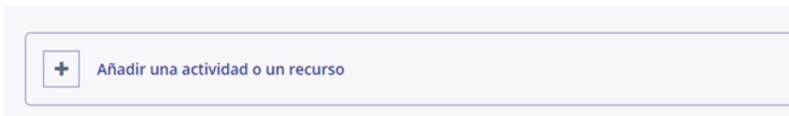
Figura 2. Botón de añadir actividad o recurso

El siguiente paso, es identificar la semana o unidad en la que desea agregar el foro. Una vez identificada, diríjase al final de la plataforma y haga clic en Añadir una actividad o recurso, seleccionando la opción Foro.